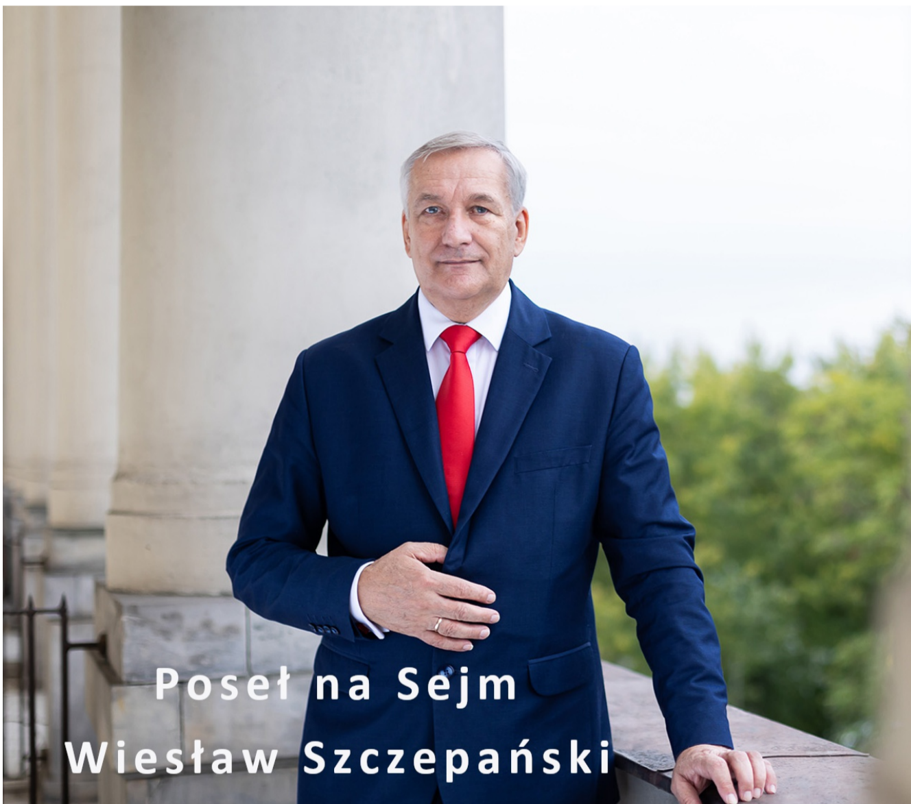
Poseł na Sejm Wiesław Szczepański