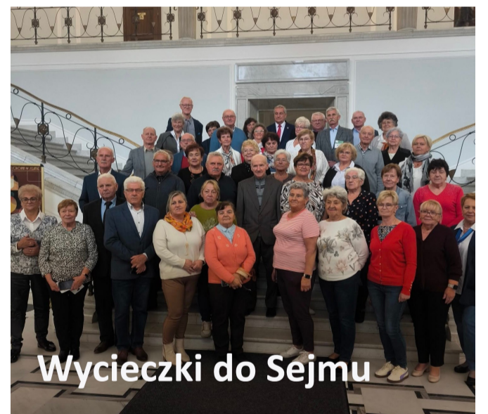
Wycieczki do Sejmu