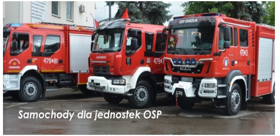
Samochody dla jednostek OSP