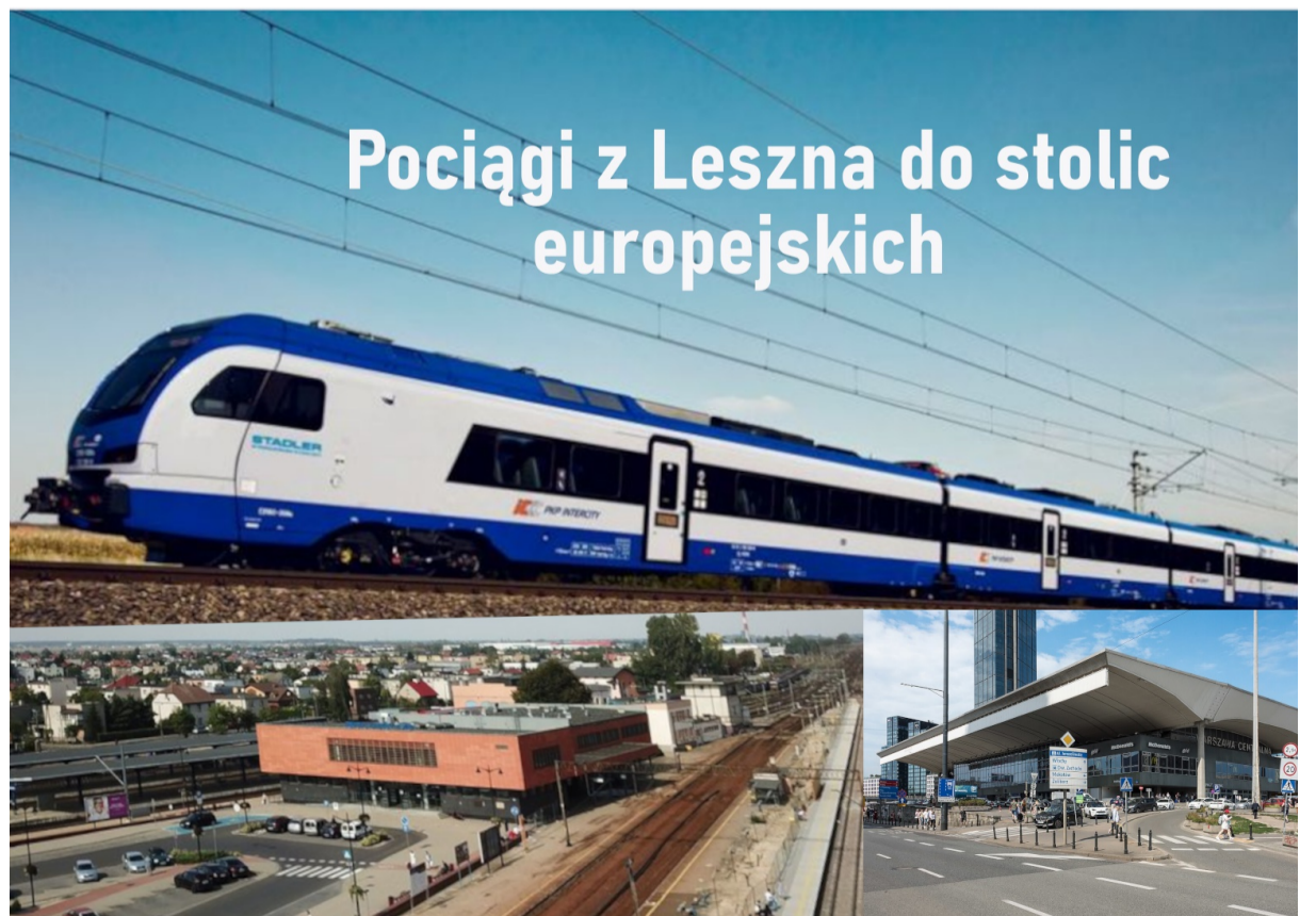
Pociągi z Leszna do stolic europejskich