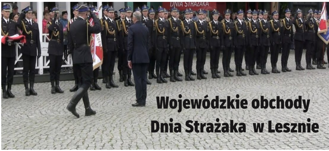
Wojewódzkie obchody Dnia Strażaka w Lesznie